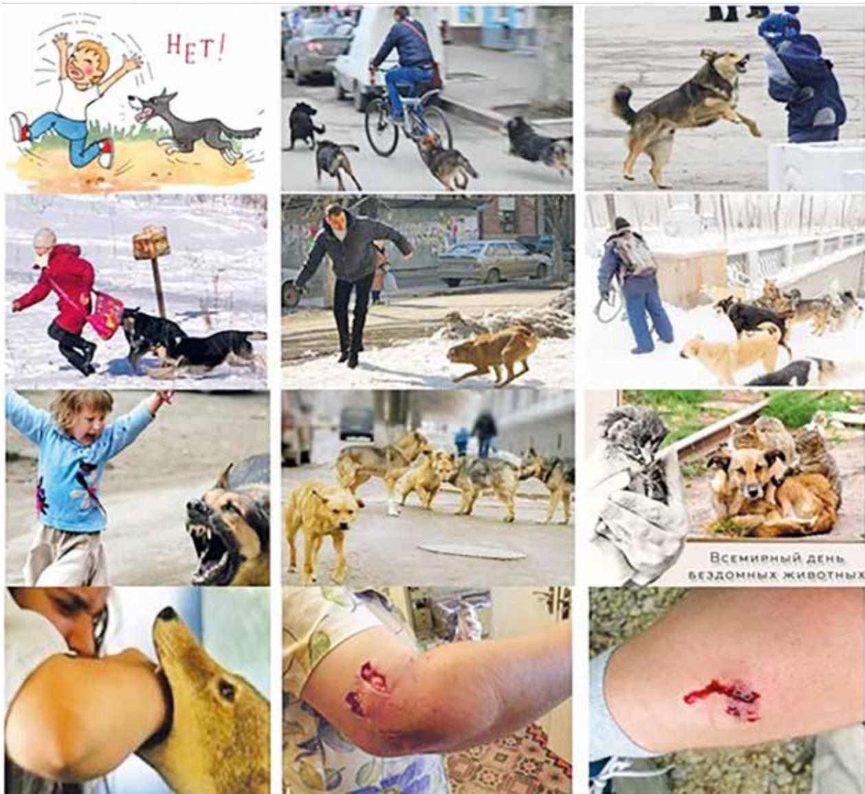
Рис. 6. Бродячие собаки в урбанизированных условиях и эффективный укус [Интернет] Stray dogs in urban areas and effective bite [Internet]