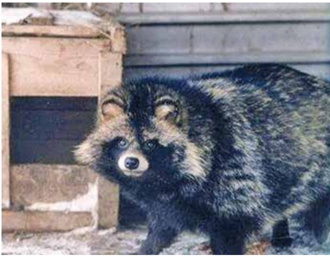
Рис. 3. Енотовидная собака около собачьей конуры чувствует себя как дома. Raccoon dog near a dog kennel feels at home.

В связи с «собирабельным» типом питания [13], особенно в экстремальных ситуациях, енотовидная собака (ЕС) также проявляет склонность к синантропизации и концентрируются вблизи населенных пунктов, животноводческих ферм, полигонов по сбору городских отходов, свалок и иных объектов, где ее привлекают помойки, пищевые, кормовые и т. п. отбросы. В особо неблагоприятных климатических условиях наблюдались случаи временного поселения ЕС в подсобных помещениях, даже занятия помещений домашних животных (рис. 3).