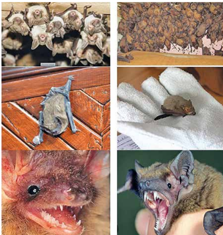
Рис. 4. Летучие мыши в условиях человеческого жилья [Интернет] Bats in human habitation [Internet]

СМИ и многочисленные открытые источники изобилуют свидетельствами подобных эксцессов (2019–2022): «Летучие мыши массово мигрируют в столичный регион», «Летучие мыши облюбовали московский Кремль: одна поселилась в музее», «Летучие мыши атакуют москвичей», «Нетопырь атаковал квартиру владимирцев», «Жилье омичей атаковали летучие мыши», «В Челябинске нашествие летучих мышей. Особенно страдают жители Ленинского района. Они не просто встречают зверьков на улице в темное время суток, а сталкиваются с ними в квартирах. Летучие мыши оказываются на балконах и в других комнатах», «Летучие мыши оккупировали харьковские высотки», «Жители Львова нашли на балконе 1700 летучих мышей, решивших там перезимовать» [Интернет] (рис. 4).