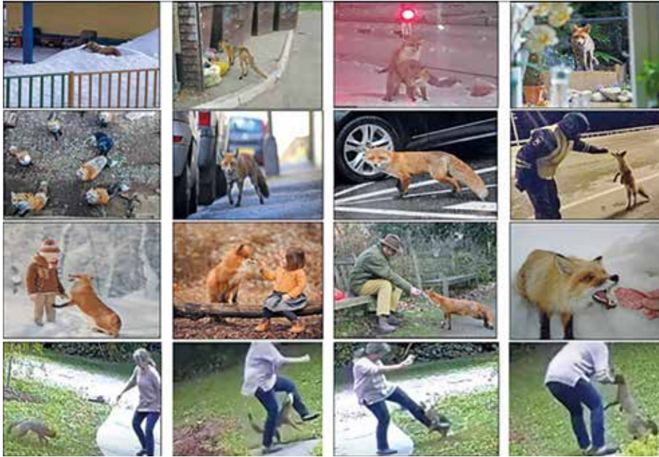
Рис. 2. Коллаж на тему «Отношения лисица + человек в городе» и нападение бешеной лисицы на человека (из открытых источников) Collage on the theme «Relationships between fox and man in the city» and attack of a rabid fox on a person (from open sources)

гуляют по набережным». Ситуацию иллюстрирует содержание рисунка 2.