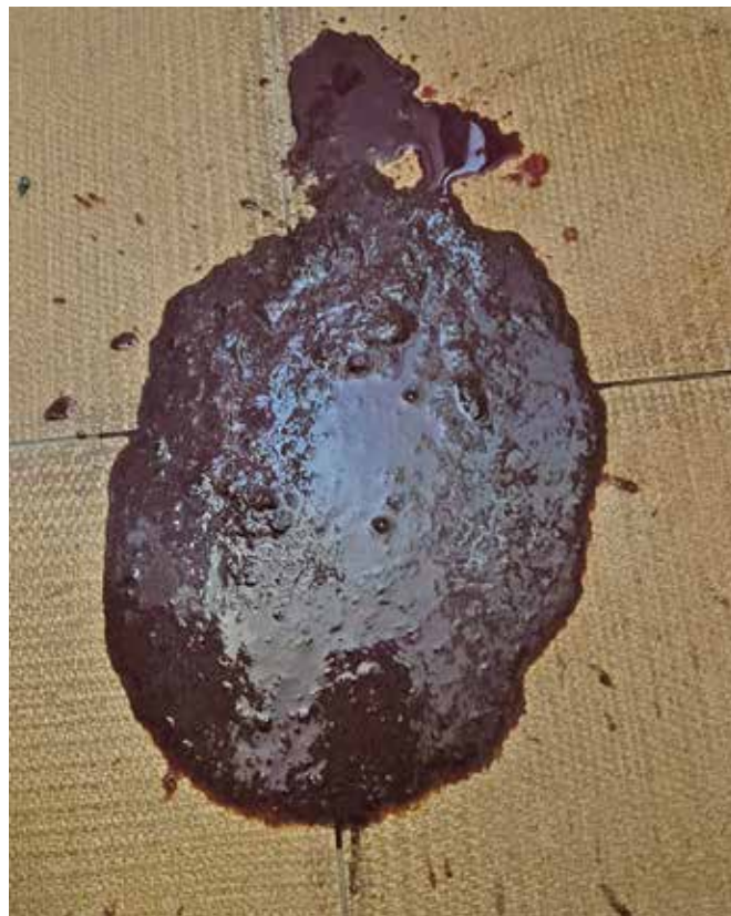
Рис. 1. Мелена, жидкий кал вишневого цвета Melena, cherry-colored liquid feces

На момент осмотра основными дифференциальными диагнозами были травматический гастроэнтерит, вызванный поеданием инородных предметов, и геморрагический гастроэнтерит собак. Последний сопровождается выраженной гемоконцентрацией (гематокрит более 55 %), гиповолемическим шоком и риском летального исхода. Поскольку щенок был