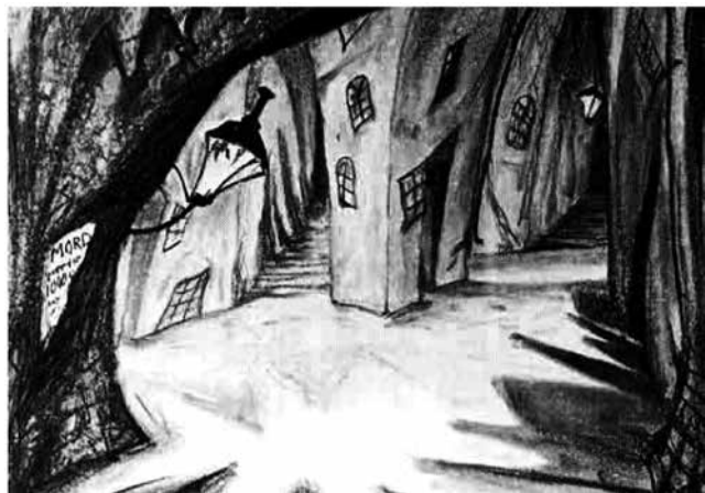
Герман Варм. Эскиз к фильму

такими же резкими, неестественными, как и изломанные линии декораций. Зритель с первых кадров лицом к лицу сталкивается с чем-то зловещим, непонятным, проникается какой-то растворенной в воздухе угрозой и «переживает волнующий мир больного».