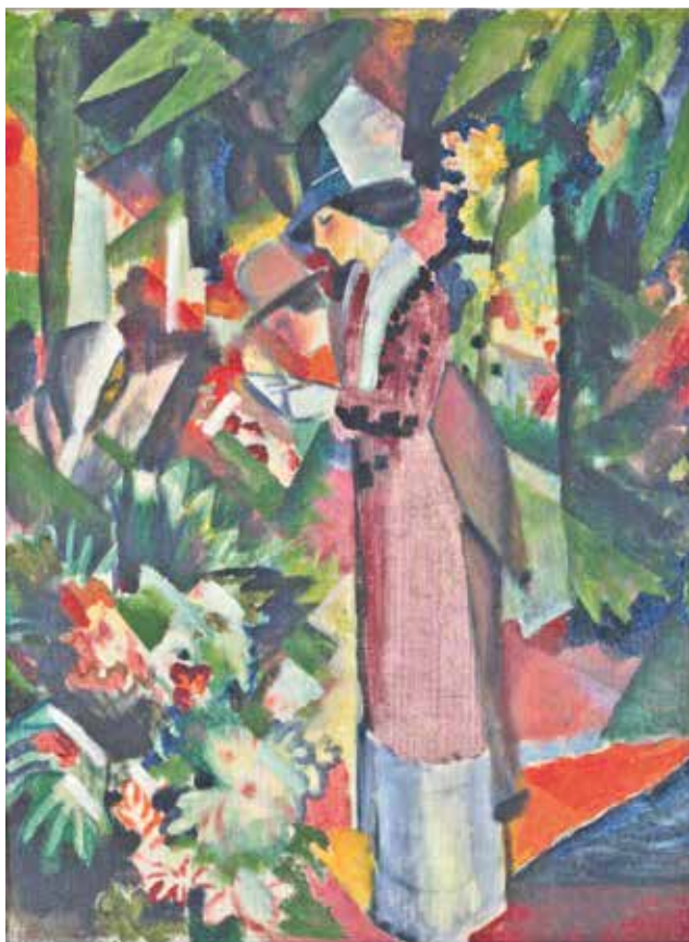
Прогулка в цветах. Август Маке

чувства и эмоции людей, а не реалистично изображать предметы. К представителям этого течения относят Э.Л. Кирхнера, Э. Мунка, А. Маке, раннего В. Кандинского.