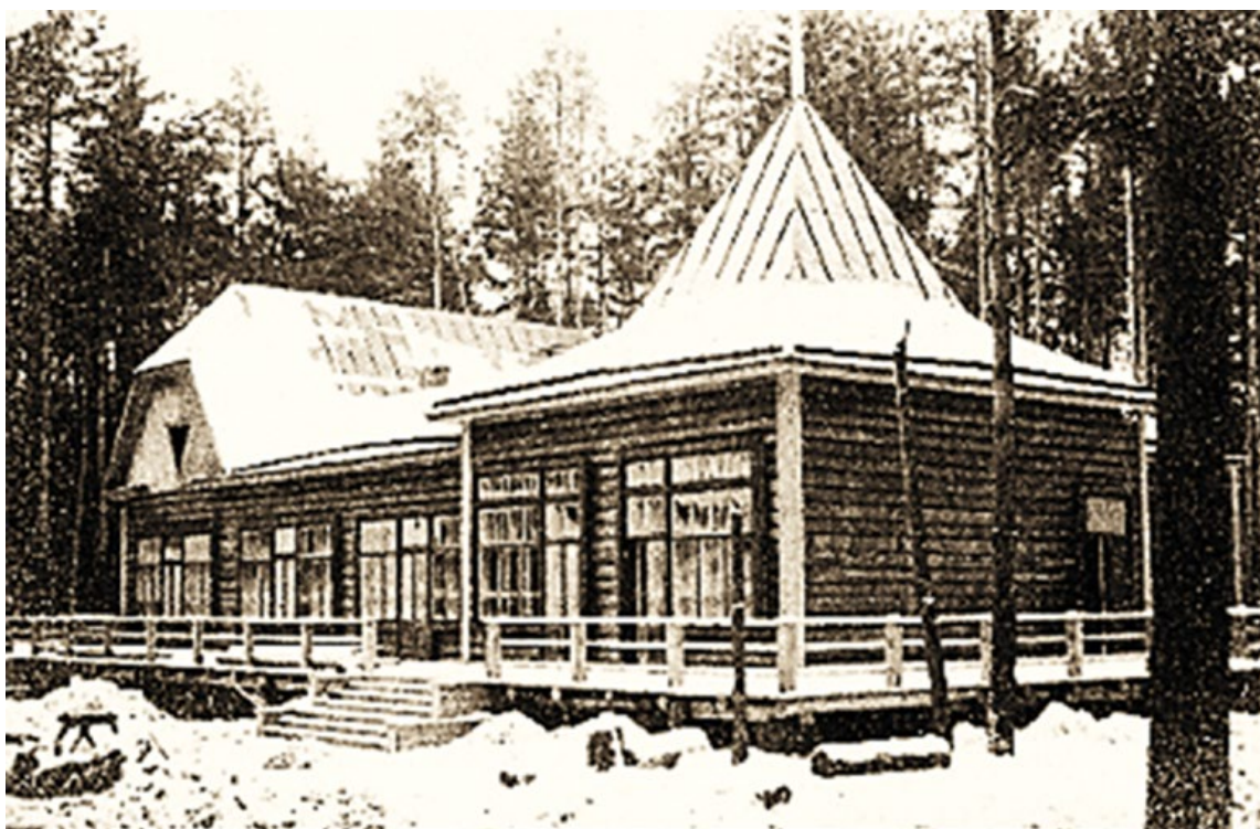
Рис. 2. Новое здание санатория (1926 г.) New sanatorium building (1926)