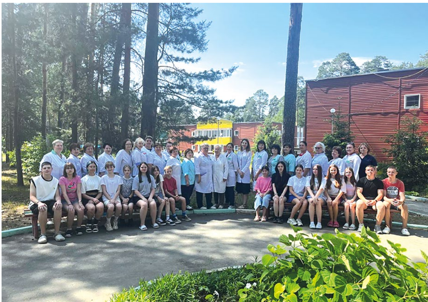
Рис. 10. Санаторий сегодня Sanatorium today

Коллектив санатория продолжает трудиться под девизом «Здоровье Вашего ребёнка — наша профессия!» Имея накопленный опыт работы, огромное желание трудиться в выбранной профессии, работники санатория уверенно смотрят вперёд. Они сегодня, как и все 105 лет, готовы отдавать все силы и душу для лечения каждого маленького пациента (рис. 10).