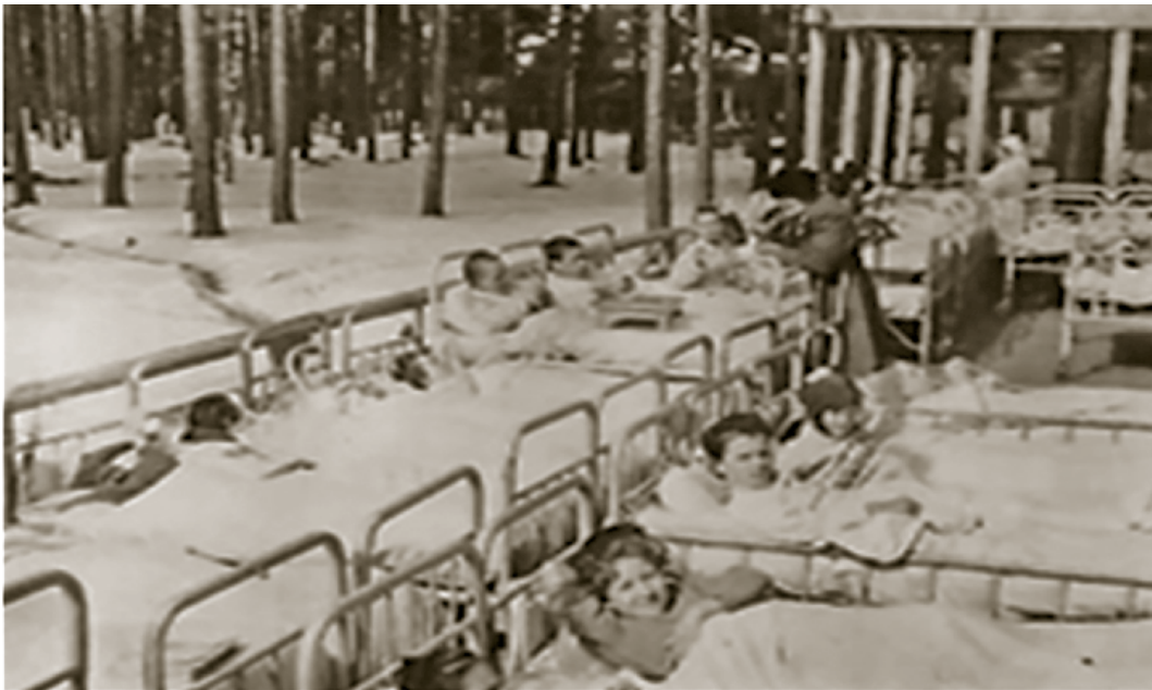
Рис. 4. Климатотерапия (40-е годы) Climatotherapy (the 40s)