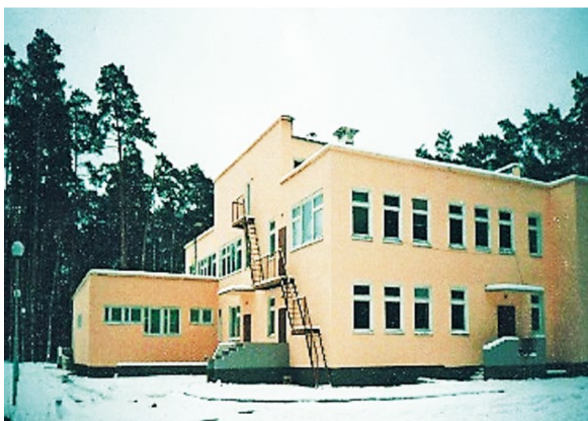
Рис. 9. Результаты реконструкции спальных корпусов, пищеблока и школы (начало 2000 гг.) The results of the reconstruction of dormitories, food hall and school (early 2000)