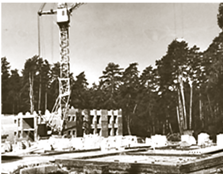
Рис. 8. Начало реконструкции санатория (1992–1995 гг.) The beginning of the sanatorium's reconstruction (1992–1995)

Несмотря на кризисную ситуацию в стране (в 1996 г. все работы по реконструкции были