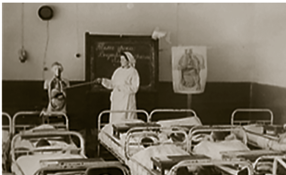
Рис. 3. Учебно-воспитательный процесс (40-е годы) Educational process (the 40s)

десятилетие доля взрослых коек уменьшалась, и в 1936–38 гг. организуется детское костное туберкулёзное отделение, а в 1939 г. санаторий был преобразован в областной детский костно-туберкулёзный на 260 коек, из них 210 костно-туберкулёзных и 50 лёгочных. Открылась школа, у детей появилась возможность во время лечения